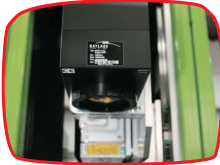
Cabeça de laser Raylase | Raylase laser head