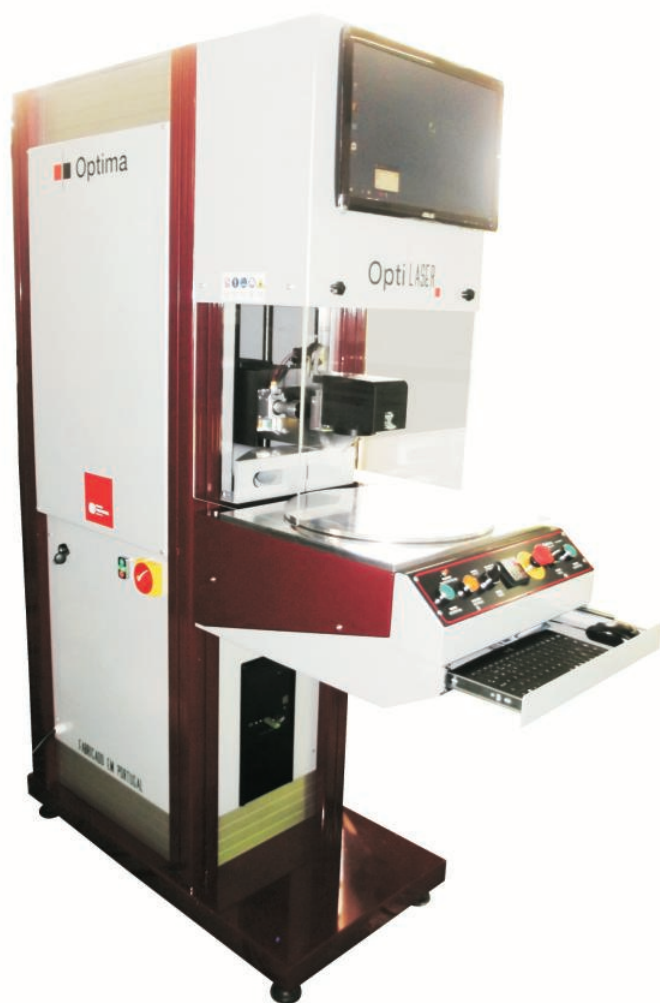
OptiLASER EP 030 005 Rotary