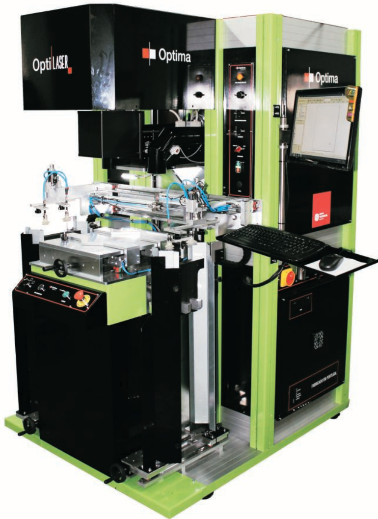
OptiLASER RF 135 001