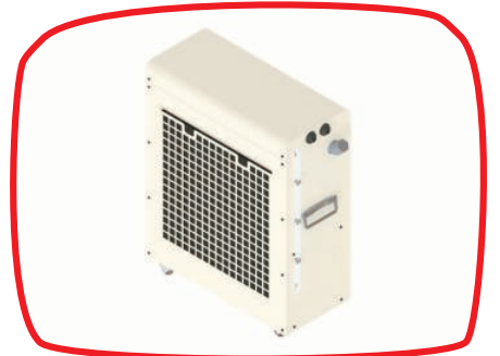
Refrigerador a água | Water cooling