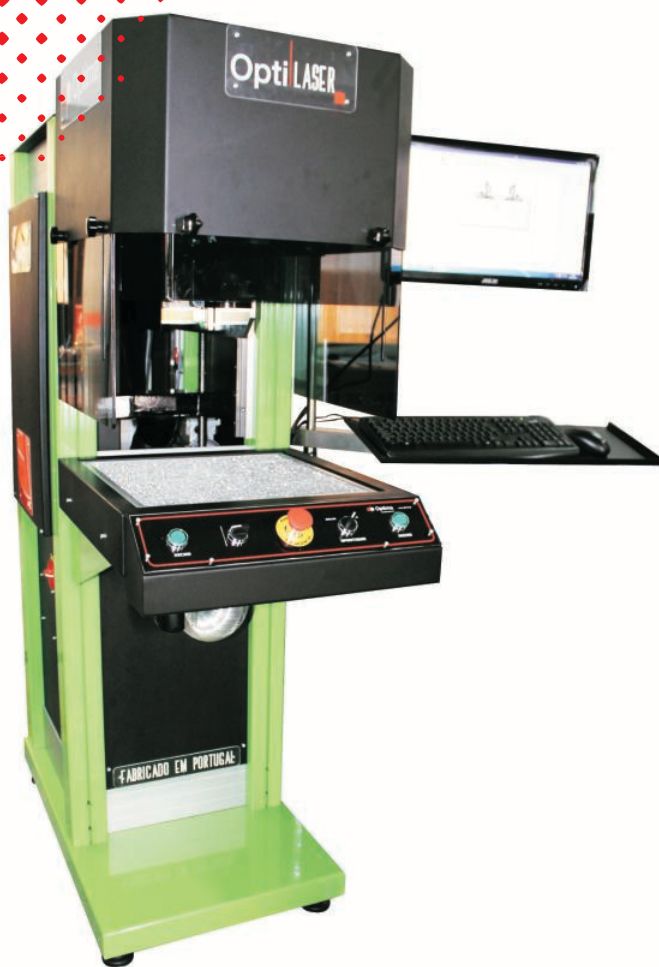
OptiLASER EP 030 005