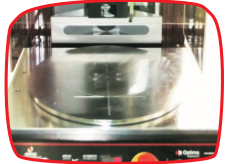
Prato rotativo (2 posições) | Rotary plate (2 positions)