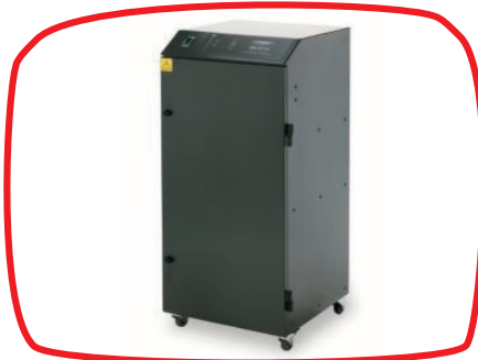
Extrator e filtragem de fumos (Bofa) | Smoke extractor and filtering (Bofa)