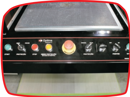
Mesa de favos | Vector grid